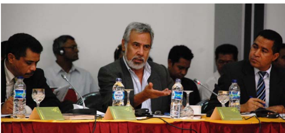
Sua Exelensia Primeiro-Ministro halo diskursu kona-ba desentralizasaun, no iha sorin liman karuk Ministro da Educação no iha liman lós Ministro da Administração Estatal e Ordenamento do Território

Sorumutu Nasionál hala'o hodi fó oportunidade ba Ministro sira hodi relata serbisu grupu trabalho técnico kona-ba desentralizasaun ba Sua Exelensia Primeiro Ministro. Alem de ida ne'e, atu Ministro sira informa kona-ba funsaun hirak ne'ebé sira identifika atu desentraliza ba Governo Lokál iha futuro, no fó oportunidade ba partisipante hotu-hotu atu depois rona tiha funsaun hirak ne'ebé identifika, bele halo diskusaun kona-ba impaktu husi funsaun desentralizasaun hirak ne'e.