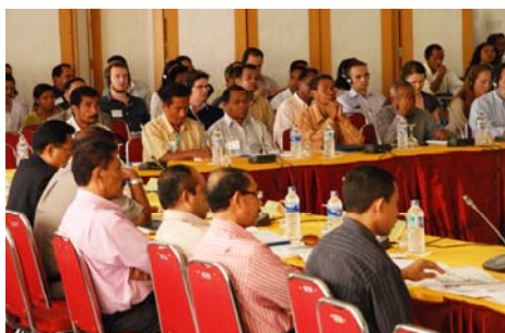
Partisipantes iha Sorumutu Nasionál halo diskusaun sobre apresentasaun husi Ministerio Grupu Trabalho Técnico