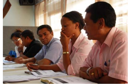
Enkontru Ministerio Saude nia Grupu Trabalho Tekniku ne'ebe hala'o iha 23 Jullu 2008 wainhira sira apresenta sira nia rekomendasaun kona-ba desentralizasaun

puntu fokal ba GTT Ministerio Saúde, mós esplika katak funsaun balun seidauk bele no karik labele fó ba nivel lokál. “Iha funsaun ne'e, ami altura diskute, ami labele fó hotu kedas ba nivel lokál. Iha funsaun balun ke nivel sentral sei kaer, hanesan política no rekursu humanu,” hatete Sr. dos Santos.