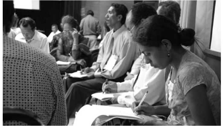
Partisipantes iha Sorumutu Nasional husi Distritu Bobonaro diskuti kona-ba sira nia esperensia iha PDL.

S.E. Ministro Dr. Arcângelo Leite iha sorumutu ne'e hateten, "Governo iha kontiudo atu aselera politika kona-ba decentralizasaun. Ita buka atu korije buat ne'ebé lalos, no halo evaluasun kona-ba serbisu ne'ebé ita halo ona to'o agora." Tan ne'e, sorumutu ne'e importante atu